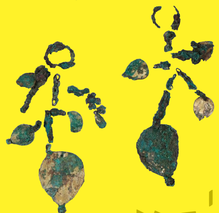
金銅馬形飾付透彫冠 金銅垂飾付耳飾(国重文 三味塚古墳出土資料 当館蔵)