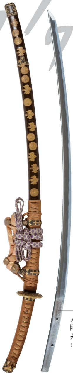
太刀 銘 則包 附黒漆塗菊桐紋散金蒔絵 糸巻太刀拵 (国重文、水戸東照宮蔵(当館寄託))