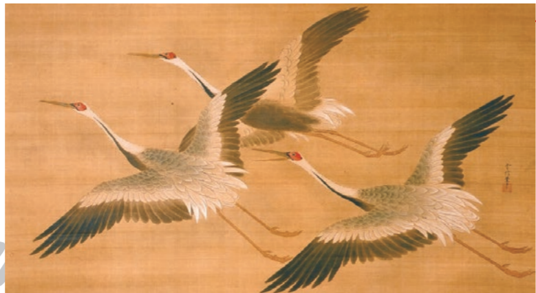
舞鶴図 狩野常信筆(国重文、一橋徳川家関連資料、当館蔵)