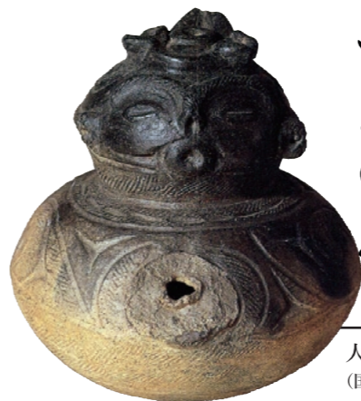
人面付注口土器 (国重文、辰馬考古資料館蔵)