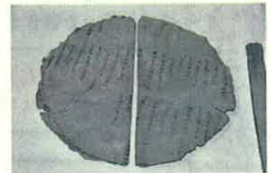
漆紙文書、特殊なカメラで撮影した状態を復元した