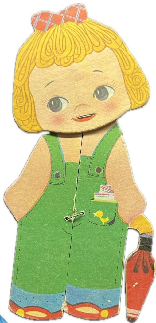
紙人形(雑誌付録) 当館蔵