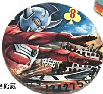
めんこ 昭和40年代 当館蔵