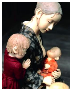
「かあちゃんよんで」 安部朱美作 2007年