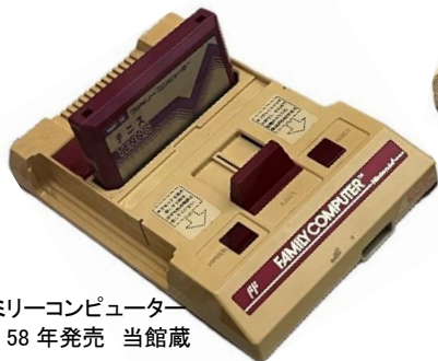
ファミリーコンピュータ 昭和58年発売 当館蔵