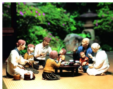
「ちやぶ台囲んで」 安部朱美作 2009年