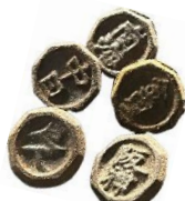
ペーゴマ 昭和20年代 当館蔵