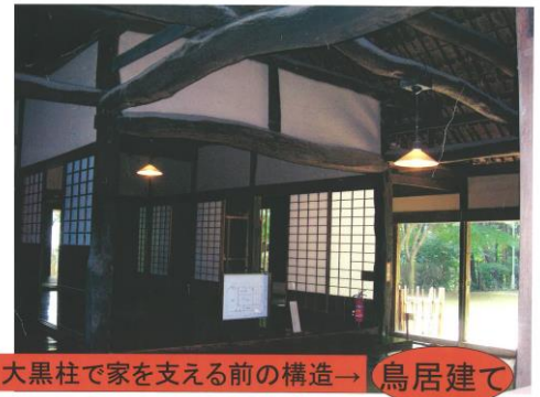
大黒柱で家を支える前の構造→鳥居建て