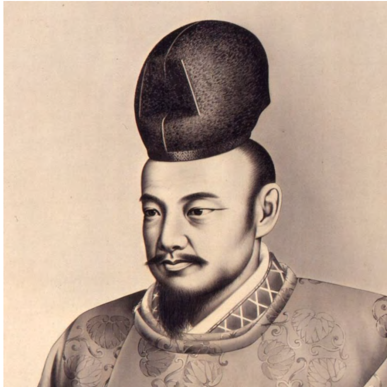
「徳川齊昭肖像画」 幕末と明治の博物館蔵