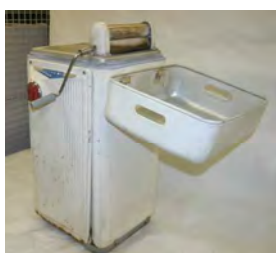
「電気洗濯機」 日立製作所製 昭和32年製造 販売価格 23,000円

ひとまとめに「三種の神器」と総称されてはいますが、それぞれが普及した時期や普及の速度には差があります。その差を比べると、当時の日本の家庭で何が求められていたかがより明確に浮かび上がってきます。例えば、三種のうちで最も早い時期から売れ始めたのは「電気洗濯機」でした。内閣府の統計によると昭和30年には約10%の家庭で所有していました。同時点で「白黒テレビ」は約3%、「電気冷蔵庫」は約1%にしか達していません。主婦にとって最も厳しい労働といわれたタライと洗濯板の作業からの解放が、いかに望まれていたかがわかります。また、最も短期間で急激に普及が進んだのが「白黒テレビ」です。昭和33年での所有率は20%に達していませんでしたが、昭和34年からは年々10%を大きく超える伸び率を続け、昭和40年には約90%の家庭で所有しており、テレビは家庭生活に欠かせないものになりました。昭和34年の当時の皇太子御成婚や昭和39年の東京オリンピックのテレビ放送が大きな要因になったといわれますが、高度経済成長期における生活の余裕の現れであることは確かです。テレビの普及により、伝達される情報の量は格段に増加しましたが、家族の目はテレビに向くことが多くなり、囲炉裏やちゃぶ台に集まり互いの顔を見て過ごす時間は確実に減少していったのです。