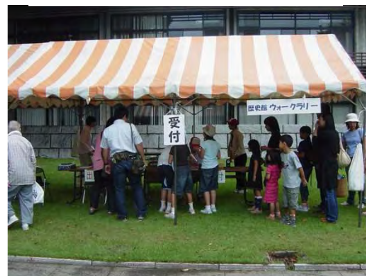
歴史館ウォークラリー