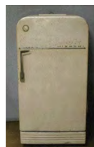
「電気冷蔵庫」 日立製作所製 昭和32年製造 販売価格 62,500円