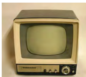
「白黒テレビ」 早川電気製 昭和35年製造 販売価格 58,000円