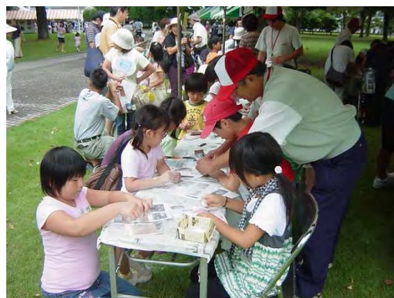
まがたま作り体験

まがたま作り体験では、親子で「まがたま作り」にチャレンジしたり、歴史館ウォークラリーでは、多くの子どもたちが庭園内の各ポイントに設置された問題を解きながら楽しそうにスタンプを集める姿がみられました。