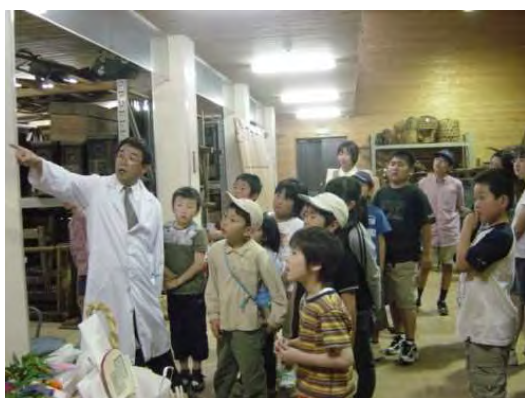
民俗収蔵庫内での説明