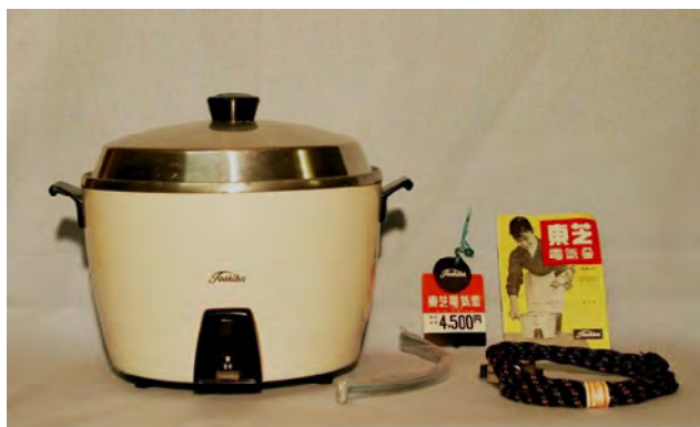
「自動式電気釜」 東芝製 昭和30年製造 販売価格 4,500円

今では大変貴重な資料である自動炊飯機の第1号機を、昨年度茨城県立歴史館に寄贈いただきました。開発した三並義忠氏の後継会社が風美子氏の出身地である常陸大宮市にあることもあり、茨城で50年間保存されてきたものです。