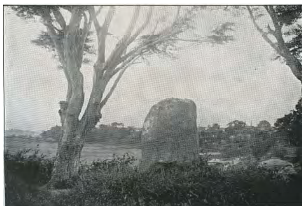
水戸八景「太田落雁」(100年前の風景)

斉昭6女松姫が、盛岡藩主南部利剛に嫁ぐにあたり 斉昭が利剛に贈った笛（岩手県立博物館蔵）