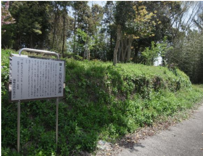
鹿嶋市比屋久内遺跡

鹿嶋市内には、風土記の記事を裏付けるように製鉄・鍛冶関連の遺跡がいくつか調査されています。まず、砂鉄から鉄を取り出した製鉄炉の遺跡として、比屋久内遺跡があります。その全容は明らかではありませんが、昭和56年に行われた調査では、平安時代の製鉄炉が見つかっています。現在、遺跡は市の史跡に指定されています。