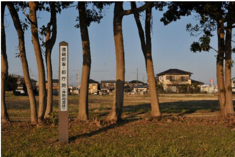
鹿嶋市神野向遺跡

その香島郡ですが、孝徳朝の大化5年（649）、下総の海上国の1里と那賀国の5里を割いて設置されました。天の大神の社・坂戸社・沼尾社を合わせて香島の天の大神（今の鹿島神宮）と称し、郡の名はそれに由来します。風土記には「別置神郡」とありますので、香島郡は神郡として神宮の維持・管理なども担当する特殊な立場に置かれました。郡家は神宮の南方に位置する神野向遺跡で、調査の結果役所の建物は3回建てられており、西側（北浦側）に正倉が置かれていました。ここからは「神宮」と書かれた墨書土器、帯飾金具などが出土しており、特に前者は先にふれた神宮との関係を示す資料です。ただ、風土記によりますと元の郡家は沼尾にあったとの記述がありますので、神野向遺跡は移転後の郡家となります。移転前の郡家については、今のところそれらしき遺構は見つかっていません。（続く）