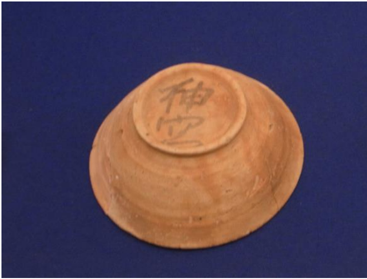
墨書「神宮」神野向遺跡出土（鹿嶋市どきどきセンター蔵）