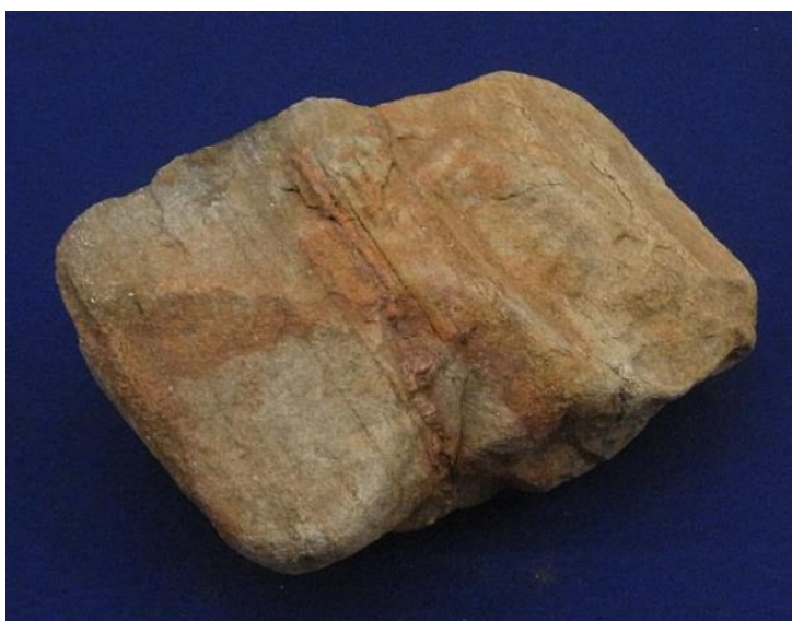
片岡遺跡から出土した金床石（鹿嶋市ときどきセンター蔵）