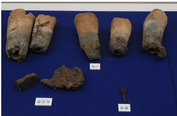
春内遺跡から出土した鍛冶関係の遺物（鹿嶋市ときどきセンター蔵）