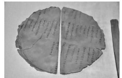
漆紙文書、特殊なカメラで撮影した状態を復元した

問題8 奈良時代の農民の負担をパネル（税の制度）からさがしてみよう。 （ ）・・・収穫量の約3%をおさめた （ ）・・・布や地方の特産物をおさめた （ ）・・・1年に10日働くかわりに布をおさめた