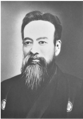
茨城県初代知事（参事） 山岡高歩

旧石器時代 縄文時代 弥生時代 古墳時代 奈良時代 平安時代 鎌倉時代 室町時代 江戸時代 明治・大正・昭和時代